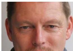
Beide oogleden zijn gaan zakken Zowel rationeel als gevoelsmatig meer introvert